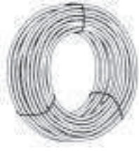
Figure Figura Abbildung Figure