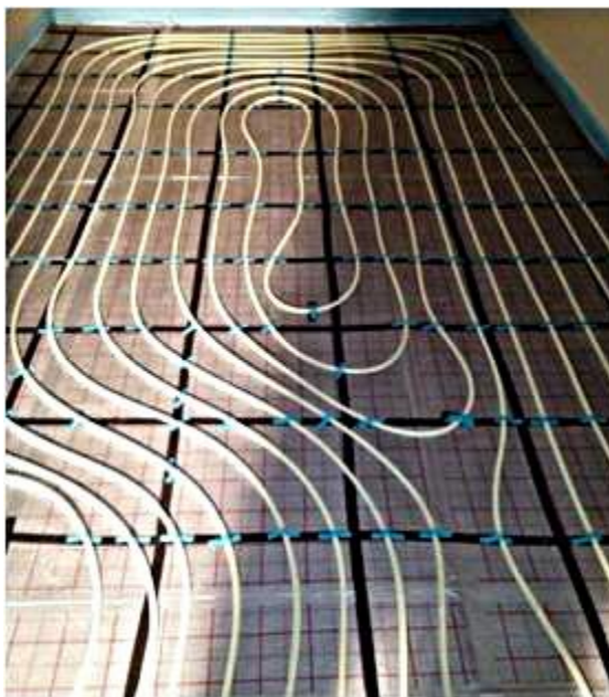
Abb. 4: Fertig verlegte Fussbodenheizung