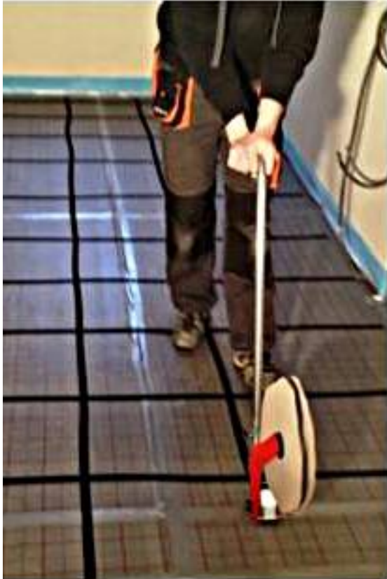
Abb. 3: Flauschband-Abroller im Einsatz