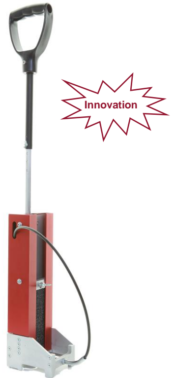
Abb. 2: Klettband-Tacker