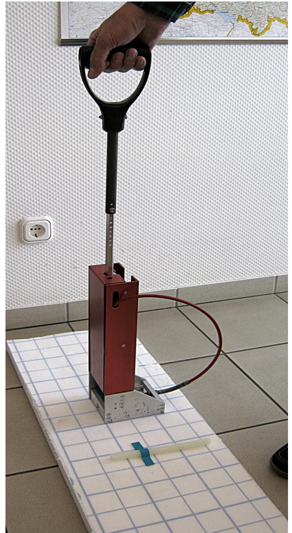
Abb. 5: Klettband-Tacker angewendet auf Isolation mit Flies (Velour)